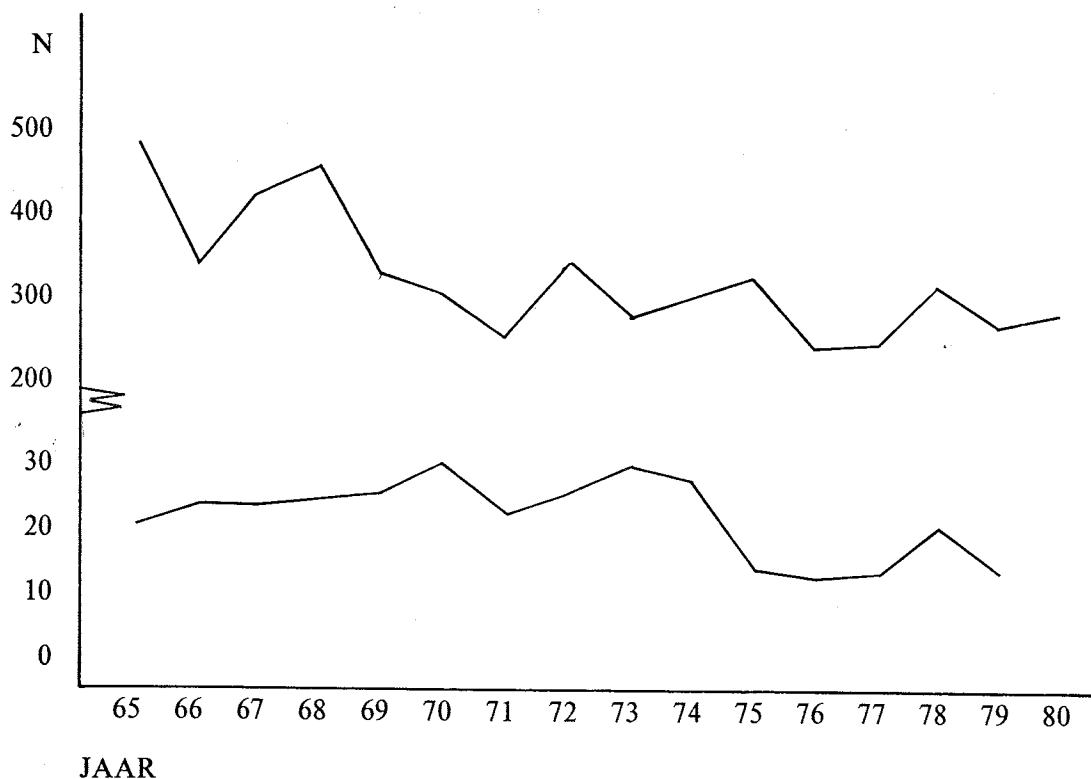
Figuur 1. Evolutie van het aantal interneringen tussen 1965 en 1980