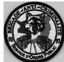
FIGUUR 1: VOORBEELDEN VAN ÉCUSSENS VAN FRANSE SPECIALE POLITIE-EENHEDEN 4